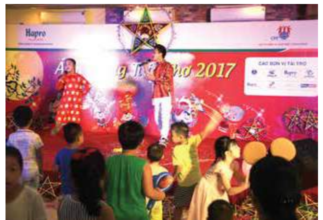
Các em nhỏ hưởng ứng các tiết mục ca múa nhạc