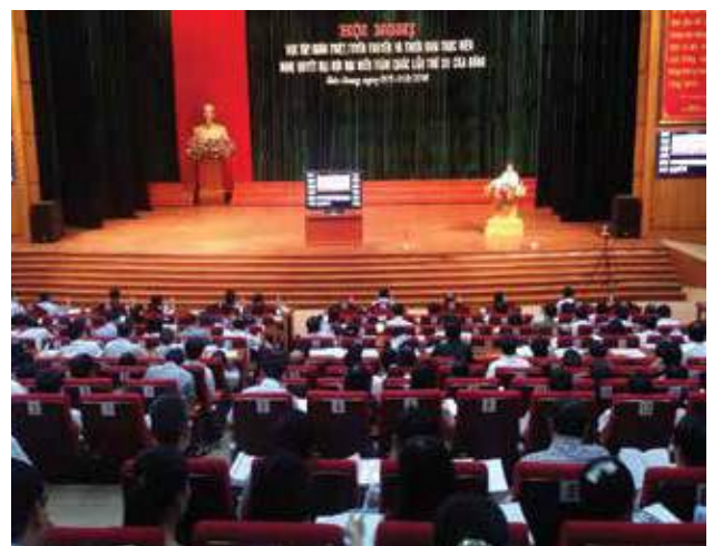
Giải pháp Hội nghị trực tuyến thực hiện bởi UBND tỉnh Bắc Giang