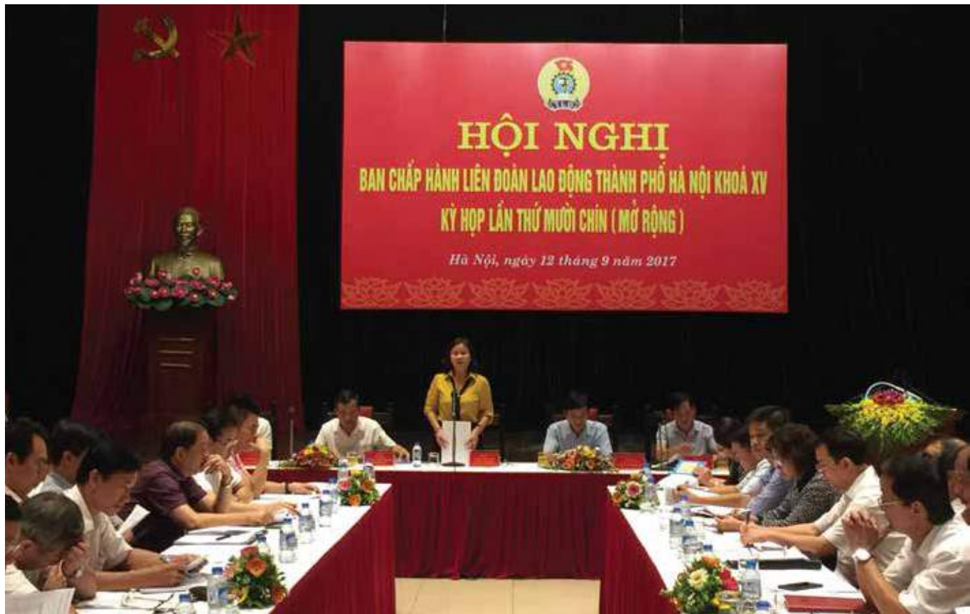
Hội nghị Ban chấp hành Công đoàn thành phố Hà Nội

phát triển đoàn viên, thành lập CĐCS ở các doanh nghiệp có từ 25 CNLĐ trở lên, điều chỉnh chỉ tiêu ký kết Thỏa ước lao động tập thể trong doanh nghiệp cho sát với thực tế, đảm bảo tính khả thi. Trong phần kiến nghị đối với Đảng, Nhà nước, Tổng LĐLĐ Việt Nam và Thành phố Hà Nội, có đại biểu đề nghị bổ sung thêm kiến nghị với Đảng nhà nước, có giải pháp sớm phổ cập giáo dục đến cấp trung học phổ thông để nâng cao được chất lượng nguồn lao động ngay từ đầu vào.