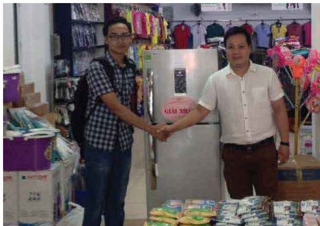
Trao giải cho khách hàng trong chương trình Bốc thăm chào mừng Lễ 30.4 và 1.5

Ngày 22/ 5/2016, Công ty Siêu thị Hà Nội đã khai trương Khu dịch vụ tiện ích tại tầng 2 tòa nhà 362 Phố Huế với các dịch vụ như: Coffe, Fastfood, Quà quê, Cơm văn phòng... Khu dịch vụ tiện ích đã mang lại những dịch vụ tiện lợi cho CBCNV đang làm việc tại tòa nhà 362 Phố Huế và khách hàng đến giao dịch tại Tòa nhà.