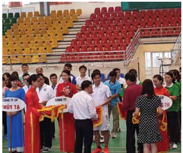
Hội khỏe Công nhân viên chức lao động TCT năm 2016

- Thực hiện công văn số 15/KH- LĐLĐ ngày 15/03/2016 của Liên đoàn lao động TP Hà Nội về việc vận động CNVCLĐ ủng hộ quỹ “ vì Trường Sa thân yêu ” để hỗ trợ, động viên, cổ vũ quân, dân huyện đảo Trường Sa, nhà dân DK1 đang ngày đêm bảo vệ biển đảo, giữ gìn sự bình yên và chủ quyền biển đảo Việt Nam, Công đoàn Tổng công ty Thương mại Hà Nội tuyên truyền, vận động toàn thể CNVCLĐ trong TCT tích cực tham gia với tổng số tiền gần 65 triệu đồng.