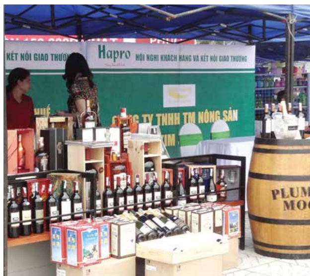
Các gian hàng trưng bày và giới thiệu sản phẩm giao thương

Chương trình Hội nghị giao thương đã diễn ra thành công tốt đẹp.