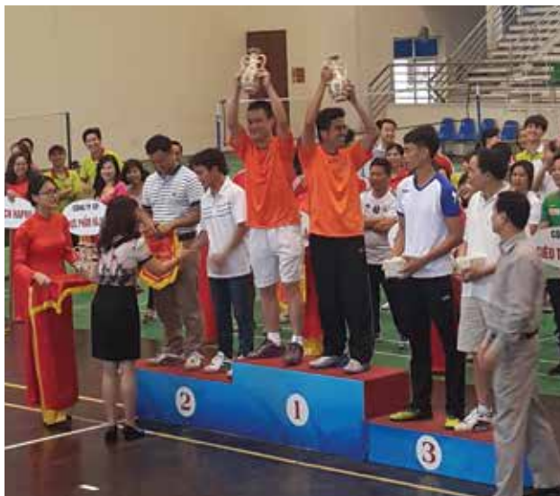
Giải nhất Đôi cầu lông nam