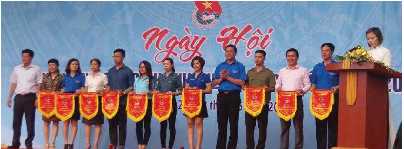
Tặng cờ các đơn vị tham gia gian hàng tại Khu nhà ở công nhân-Khu công nghiệp Thăng Long