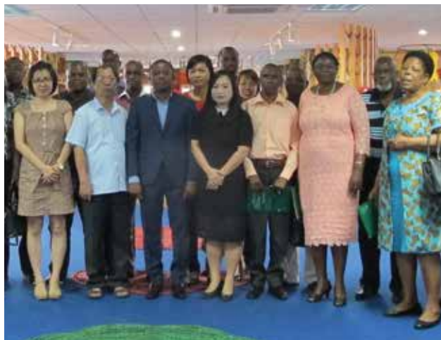
Tiếp đoàn đại biểu Mozambique tại Văn phòng TCT

- Ngoài ra, Tổng công ty đã tham dự nhiều chương trình Hội nghị, Hội thảo Bộ Công thương; Phòng Thương mại và Công nghiệp Việt Nam và Hiệp hội tổ chức nhằm tạo điều kiện cho các Doanh nghiệp được tham dự, lắng nghe các thông tin chính sách pháp luật của các nhà lãnh đạo, nhà quản lý về những chia sẻ kinh nghiệm nhằm cập nhật thêm thông tin và phục vụ hoạt động sản xuất kinh doanh của Doanh nghiệp.