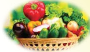
Rau được nuôi trồng tại Nông trại hữu cơ Tuệ Viên