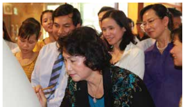
Bà Nguyễn Thị Kim Ngân - UV BCT, Chủ tịch Quốc hội ký lưu bút trên sản phẩm Gốm Chu Đậu

Chủ Tịch Quốc Hội đã biểu dương và đánh giá cao những tiến bộ nổi bật của tập thể CBNV, nghệ nhân Công ty Gốm Chu Đậu thời gian qua và