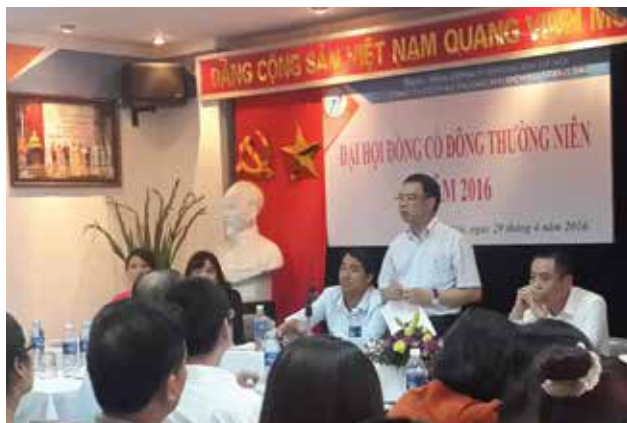
Đại hội cổ đông thường niên 2016

Đại hội đã tiến hành Bầu bổ sung thành viên HĐQT, BKS nhiệm kỳ 2015 – 2020.