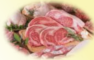
Thịt lợn được lấy trực tiếp từ Trang trại Bảo Châu