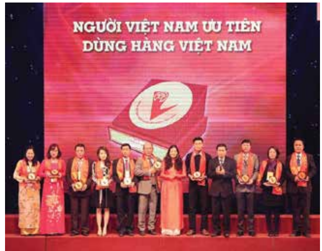
Hapro nhận giải 'Hàng Việt Nam được người tiêu dùng yêu thích'

Thông qua chương trình, nhiều thương hiệu, sản phẩm của các Doanh nghiệp Việt Nam đã khẳng định được chất lượng, tạo được niềm tin đối với người tiêu dùng.