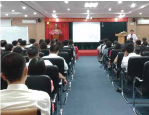
Hội nghị chuyên đề về kỹ năng xử lý, thu hồi nợ quá hạn

Tiếp tục thực hiện Kế hoạch số 100/KH-UBND ngày 21/4/2015 của UBND Thành phố về hỗ trợ pháp lý cho doanh nghiệp trên địa bàn thành phố Hà Nội và Kế hoạch số 250/KH-TCT-PLHD ngày 18/3/2015 của Tổng công ty về tuyên truyền phổ biến kiến thức, giáo dục pháp luật năm 2015; Lần lượt trong các ngày 14/10/2015 và 28/10/2015, Tổng công ty đã tiếp tục phối hợp với Sở Tư pháp Hà Nội tổ chức Hội nghị tập huấn với chuyên đề “Kỹ năng ký kết hợp đồng thương mại và những giải pháp hạn chế rủi ro khi đàm phán ký kết hợp đồng” và “Kỹ năng xử lý thu hồi nợ quá hạn, nợ khó đòi trong doanh nghiệp và nâng cao hiệu quả sử dụng vốn trong hoạt động sản xuất kinh doanh”. Các buổi tập huấn trên đã thu hút khoảng 50 đại biểu tham dự/lớp. Hội nghị đạt kết quả tốt, đã góp phần giúp cho các đồng chí đại diện các Phòng, ban quản lý Tổng công ty; các Đơn vị trực thuộc Công ty mẹ và các Công ty thành viên Tổng công ty trang bị những kiến thức cơ bản của pháp luật hiện hành về hợp đồng cũng như các kiến thức về tiến trình quản lý công nợ và quy trình làm việc trong thu hồi công nợ, kỹ năng cốt yếu cho người làm công tác thu hồi công nợ.