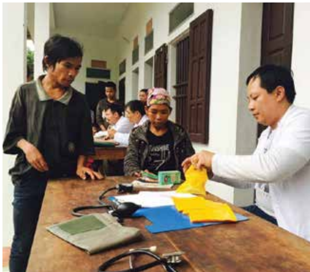
Thăm và tặng quà đồng bào dân tộc Chứt tại Hương Khê, Hà Tĩnh

- Chủ động xây dựng kế hoạch hoạt động Tết Nguyên đán Bính Thân 2016 và trình xin ý kiến chỉ đạo của Thường trực Đảng ủy TCT để triển khai.