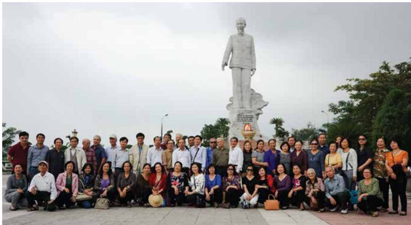
Đoàn cán bộ hưu trí thăm quan tại Kim Bôi, Hòa Bình

Tiếp tục phát huy những thành tích đã đạt được trong năm qua, tổ chức CĐ các cấp quyết tâm hoàn thành xuất sắc các chỉ tiêu kế hoạch được giao và các chương trình kế hoạch tổ chức phong trào thi đua trong năm 2016.