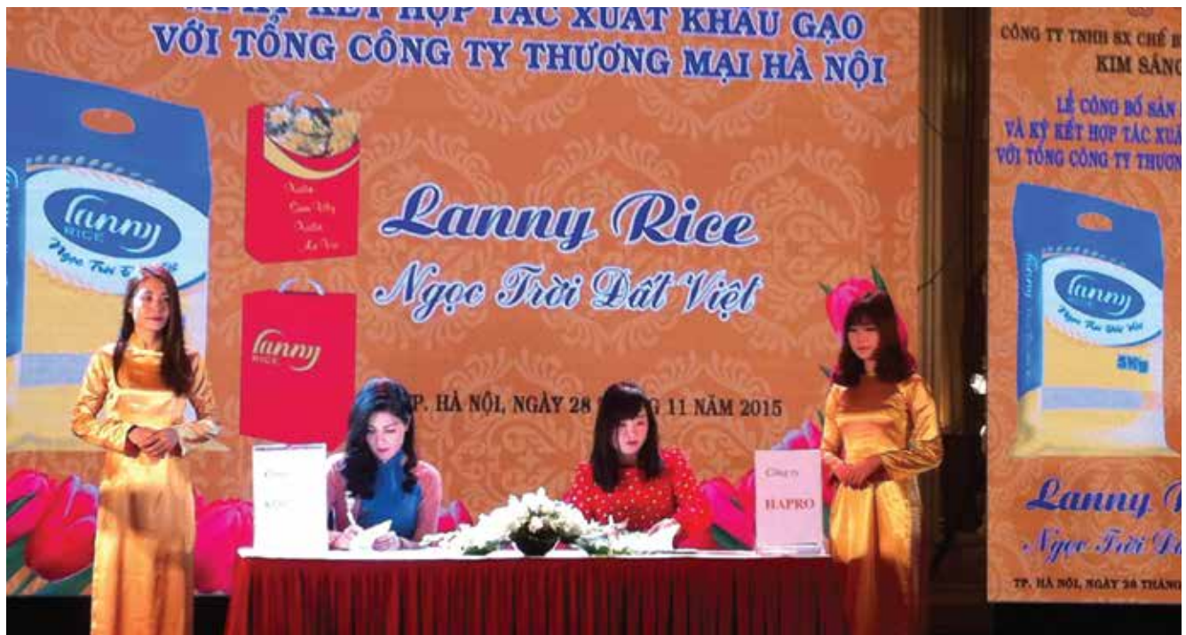
Ký kết hợp tác xuất khẩu gạo mang thương hiệu "Lanny Rice" giữa Công ty TNHH Sản xuất Chế biến Kim Sáng và Tổng công ty thương mại Hà Nội (Hapro)

Sáng ngày 28/11, tại khách sạn Daewoo - Hà Nội, Tổng công ty Thương mại Hà Nội phối hợp với Công ty TNHH Sản xuất Chế biến Kim Sáng tổ chức Lễ công bố sản phẩm và ký kết hợp tác xuất khẩu gạo mang thương hiệu "Lanny Rice". Sự kiện vinh dự