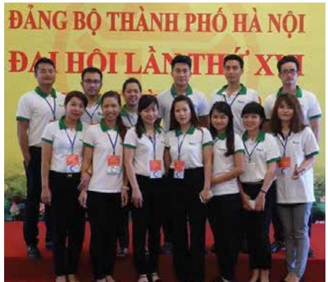
Đoàn thanh niên tham gia phục vụ Đại hội XVI Đảng bộ TP Hà Nội