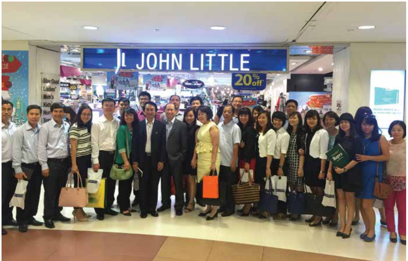
Khóa đào tạo “Nhà Quản trị cao cấp” đi thực tế tại Singapore

Khóa học kết thúc đạt được nhiều thành công tốt đẹp và dự kiến buổi bế giảng sẽ diễn ra vào đầu tháng 01/2016.